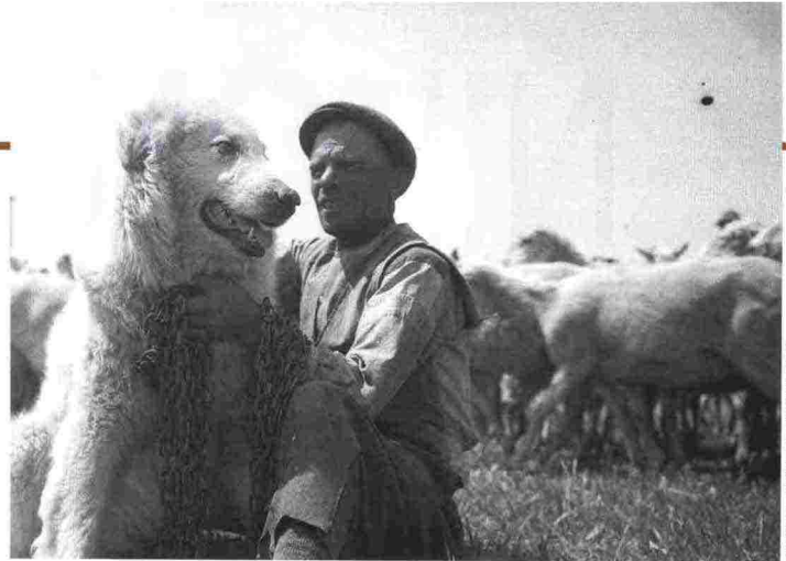
FEDERICO PATELLANI, PUGLIA, 1947

50 anni di storia imbevuti di vita rurale, tradizione religiosa, ritualità del culto dei morti, emarginazione sociale e degrado urbano. E poi il problema della disoccupazione, il lavoro in miniera e il tema della mafia accanto ai paesaggi bucolici e agli oggetti della cultura popolare e ai bambini. Immagini vivide in bianco e nero, alternate da dissonanti fotografie a colori saranno visibili fino al 12 ottobre. Museo di Fotografia Contemporanea , Villa Ghirlanda, via Frova 10, Cinisello Balsamo MI, www.mufoco.org (Valeria Melileo)